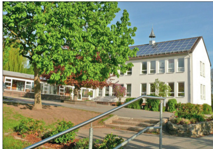
Die Grundschule Holle.

Daraus entstanden unsere neuen Busregeln und das Bustraining, das bereits zum zweiten Mal (jährlich einmal) stattfand. Außerdem wurde im Schulplan