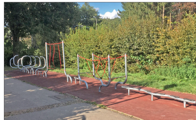
Der erste Teil des Bewegungsparcours ist bereits seit der Errichtung im Sommer 2017 im Betrieb.

Die Schüler und Lehrer Ihrer Grundschule Holle