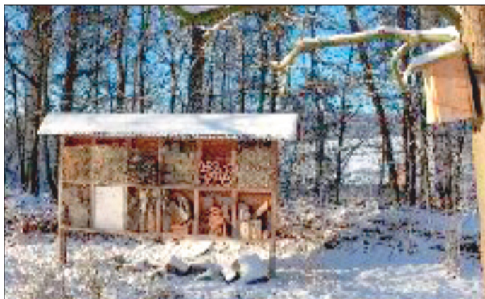
Im Werkraum werden kleine Insektenhotels gebaut.