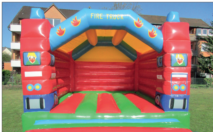
Tobespaß ist auf dieser Hüpfburg garantiert.